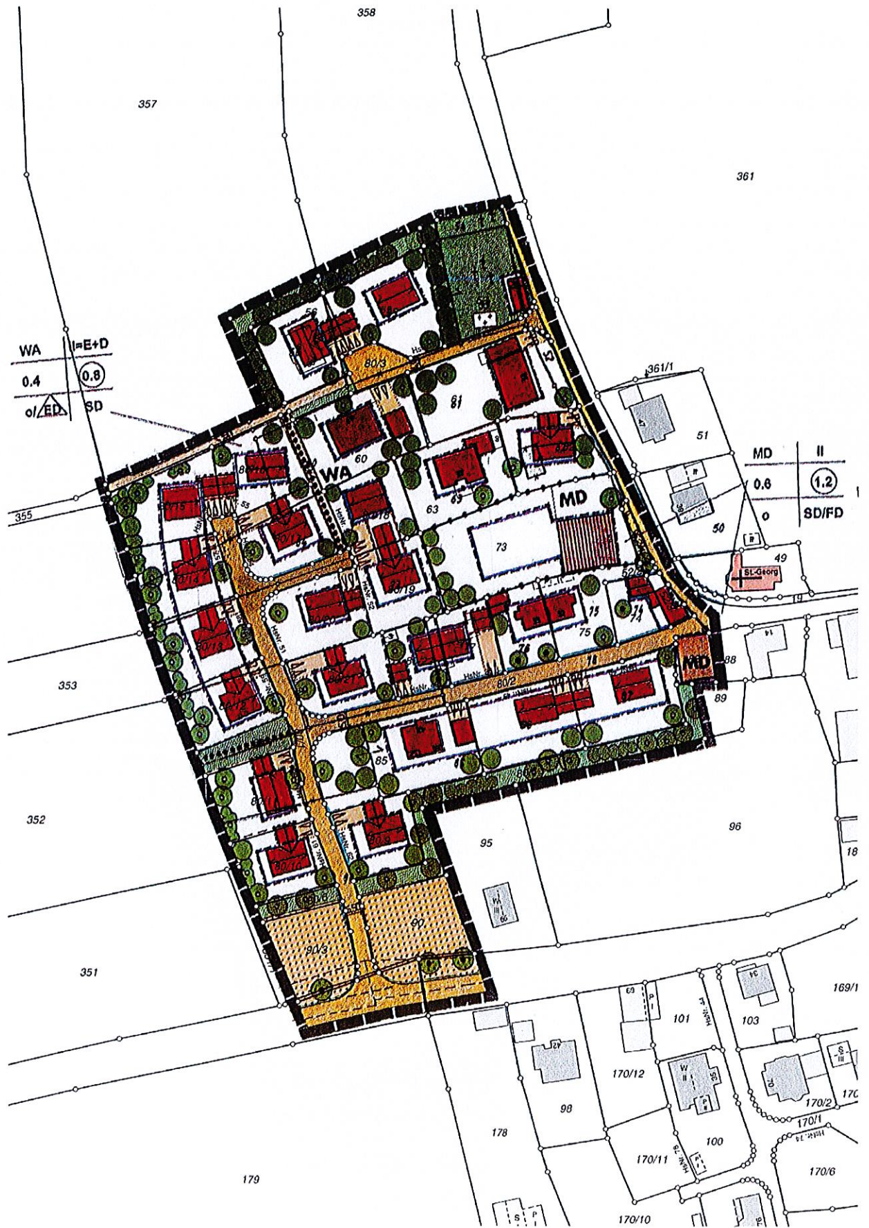
Rechtswirksamer Bebauungsplan „Obergrub Teich“ des Marktes Heiligenstadt i.OFr.