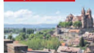
Breisach am Rhein

Ihr Hotel erwartet Sie nahe der deutsch-französischen Grenze und verfügt über ein Restaurant, eine Bar, eine Terrasse sowie Abstellmöglichkeiten für Fahrräder und Motorräder.