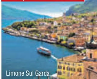
Limone Sul Garda