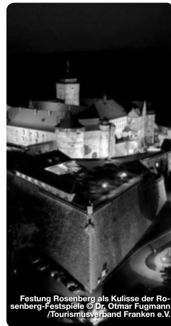
Festung Rosenberg als Kulisse der Rosenberg-Festspiele