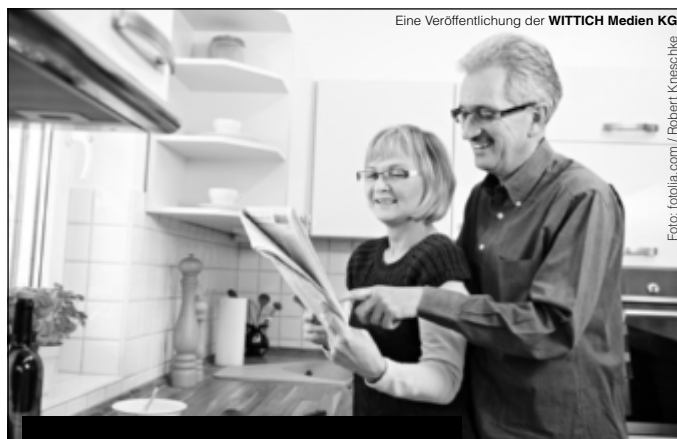
Eine Veröffentlichung der WITTICH Medien KG

Lokal informiert. Druck. Internet. Mobil.