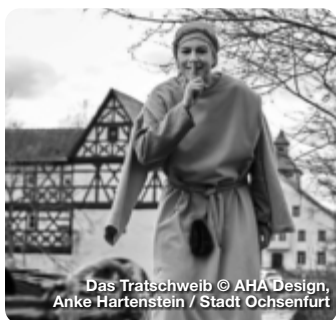
Das Tratschweib © AHA Design, Anke Hartenstein / Stadt Ochsenfurt