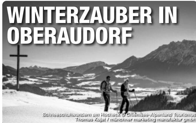
Schneeschuhwandern am Hochsee

Wenn die Wintersonne den Schnee glitzern lässt, als wären tausende von Diamanten verstreut. Wenn die weiße Pracht das Herz des Wintersportlers höherschlagen lässt und das atemberaubende Bergpanorama einem die Sprache verschlägt - dann beginnt er: der Winter im idyllischen Oberaudorf. Der kleine Luftkurort Oberaudorf im Voralpenland bietet jede Menge Wintererlebnisse fern ab von großen Touristenmassen. Zur Auswahl stehen bestens präparierte Pisten, kurvenreiche Rodelbahnen, aussichtsreiche Langlaufloipen sowie spannende Fackelwanderungen. Wellnessangebote, Gaumenfreuden und diverse Einkaufsmöglichkeiten machen Oberaudorf zu einem optimalen und einzigartigen Winter-Urlaubsort.