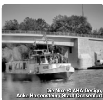
Die Nixe