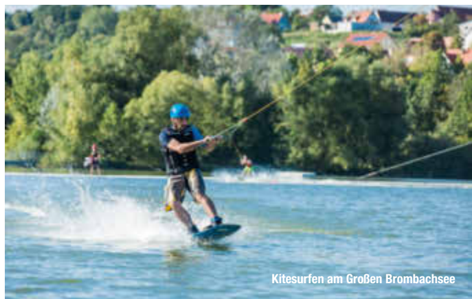
Kitesurfen am Großen Brombachsee

Reiseführer. Reisemagazine. Freizeittipps.