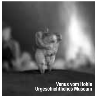
Venus vom Hohle Urgeschichtliches Museum

Wandern – Landschaftliche Vielfalt und grandioser Weitblick Die rauen Felsen und wildromantischen Täler, die dichten Wälder und die kargen Wacholderheiden machen die Schwäbische Alb zu einem faszinierenden „Revier“ für Wanderer. Wer die Felsaussichtspunkte entlang der steilen Albtraufkante oder im beeindruckenden Donautal kennt, der weiß, welche atemberaubende Aussichten einen dort erwarten. Beste Unterhaltung, Shopping, Genuss und Lebensart – das alles bieten die „Städteperlen“ der Schwäbischen Alb meist mitten im historischen Kern einer malerischen Fachwerkstadt. treffpunktdeutschland.de/schwaebische-alb