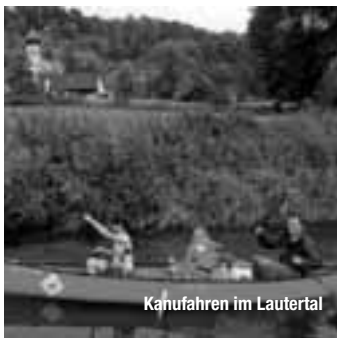
Kanufahren im Lautertal

Südlich von Stuttgart breitet sich mit der Schwäbischen Alb eine der spannendsten und vielfältigsten Landschaften Deutschlands aus. Wer die Schwäbische Alb bereist, begibt sich auf eine Zeitreise durch die Menschheits- und durch die Erdgeschichte: Aufseherregende Fossilienfunde, ein dichtes Netz von Tropfsteinhöhlen, die ersten figürlichen Kunstwerke der Menschheit, Relikte von Römern, stolze Stauferburgen und majestätische Zollernschlösser sowie zahlreiche historische Fachwerkstädte verdichten sich auf der Schwäbischen Alb zu einem einzigartigen „WeltKulturGebirge“. Zum magischen Symbol dieses geschichtsträchtigen Mittelgebirges hat sich die rund 40.000 Jahre alte Figur des „Löwenmenschen“ entwickelt. Als größte und spektakulärste Skulptur unter den weltweit ältesten figürlichen Darstellungen der Menschheitsgeschichte gilt er als eine der bedeutendsten Entdeckungen der Eiszeit-Archäologie. Bei klarer Sicht werden Wanderer sogar mit Alpenpanorama belohnt. Eine Vielzahl zertifizierter, gut beschilderter Premium- und Qualitätswanderwege erschließt das „Land des Löwenmenschen“.