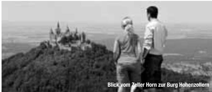
Blick vom Zeller Horn zur Burg Hohenzollern

Reiseführer. Reisemagazine. Freizeittipps.