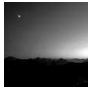
Nacht am Breitenberg