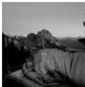
Biwakieren am Breitenberg