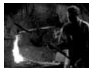
Bad Hindelang Hammerschmieden