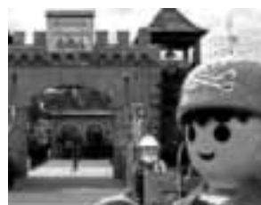
Zirndorf Playmobil FunPark