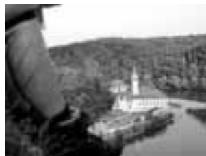
Kelheim Kloster Weltenburg