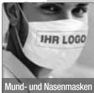
Mund- und Nasenmasken

Wir haben die passende Ausstattung Jetzt online konfigurieren und bestellen