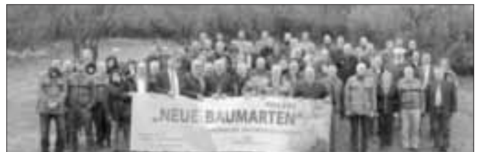
Forstwirte, Politik, Vertreter der Forstverwaltung und der Wirtschaft stehen hinter dem neuen Projekt