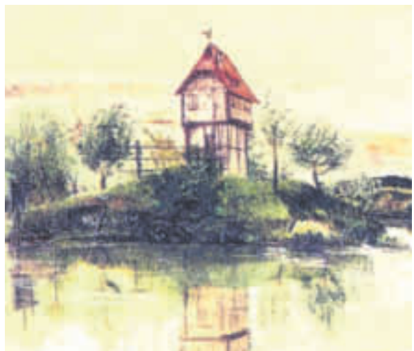
Abbildung oben: Der freistehende Glockenturm am Pfarrberg. In der Mitte: Die Lage des „Alten Wales“ oder „Burgstalls“ auf einer Karte von 1821 (Nr. 1, Eigentümer: Schloss Greifenstein). Unten rechts: So ähnlich könnte die Anlage ausgesehen haben (abgebildet ist ein sog. Weiherhaus, gemalt von Albrecht Dürer 1496/97).

Er lieferte sich zahlreiche gewaltsame Auseinandersetzungen mit Gabriel von Streitberg zu Burggrub, ehe Letzterer dann 1529 mit der Anlage, nun als „altes Wale“ und „Burgstall“ bezeichnet (d. h. dem geringen Rest einer Burg) und 9 zugehörigen Gütern in Heiligenstadt vom Markgrafen belehnt wurde. Gabriel sollte, so die Anweisung des Markgrafen, das alte Wale so auf- und ausbauen, „dass ein Edelmann darinnen wohnen könne“. Das wollte der Bamberger Fürstbischof Weigand keinesfalls dulden, zumal er sich als Landesherr von Heiligenstadt sah. Kurzerhand schickte er 1530 Truppen und ließ den begonnenen „burglichen Bau“ einreißen. Dabei kam es auch zu Schießereien und Gabriel musste zurückstecken. Gabriels Enkel, Dietrich von Streitberg zu Burggrub, ließ das sog. alte Wale um 1600 baulich teils wieder herrichten - es war 2-stöckig - und den Weiher außen herum von einem „Seegräber“ verbessern. Das Wale diente nun Jahrzehnte als Wohnung und „Synagoge“ für die herrschaftlichen Schutzjuden in Heiligenstadt. Der 30-jährige Krieg bescherte schließlich den Baulichkeiten ein Ende. Im 18. Jahrhundert wurde die mit Damm und Gräben versehene Anlage unter der stauffenbergischen Herrschaft eingeebnet und als Wiese genutzt.