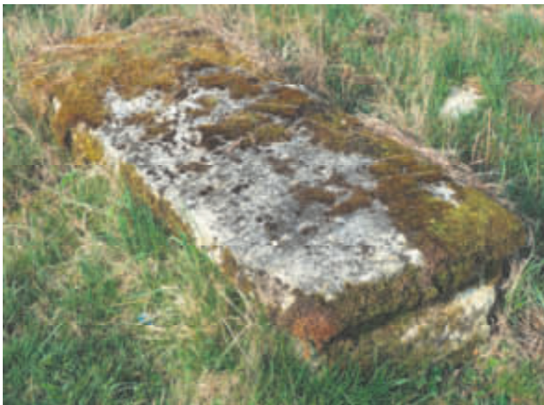
Die entfernte Grabplatte

Vor etwa 10 Jahren hat man bei der Erneuerung des Kreuzes eine schwere steinerne Grabplatte aus dem Friedhof entfernt, die sehr wahrscheinlich das Grab des adeligen Domherren abdeckte.