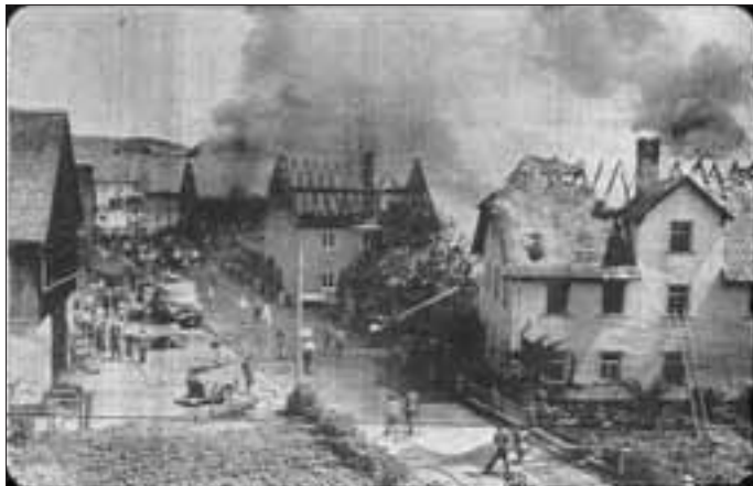
Das Feuer wütete in der Ortsmitte Siegritz

Gegen Mittag hatte man den Eindruck, dass die Flammen zurückgehen. Doch zu bändigen war das Feuer noch nicht.