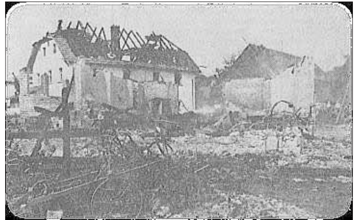
Ein Bild des Grauens

Das Haus wurde durch Wasserschaden so stark beschädigt, dass es nicht mehr bewohnbar war. Scheune, Holzlege, Schweinestall und Garage fielen beim Betrieb Krämer 22 dem Brand zum Opfer.