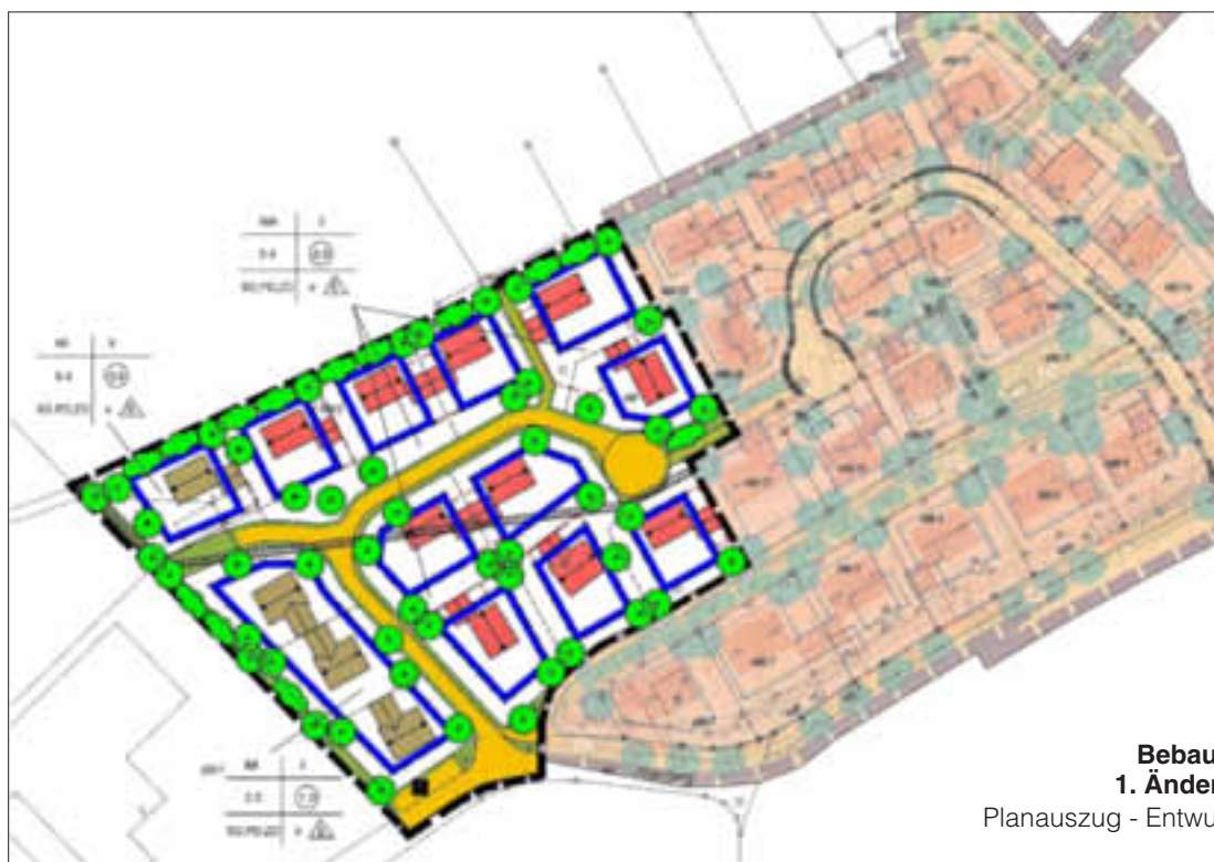
Bebauungsplan „Gründlein - 1. Änderung (Bauabschnitt II)“

Planauszug - Entwurf i.d.F. vom 26.09.2018