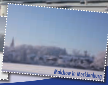
Malchow in Mecklenburg

Tel: 039932-825201 · info@ferienkontor-mv.de stadthafen-malchow.com