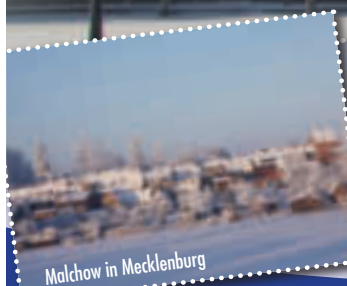
Malchow in Mecklenburg