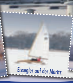
Eissegler auf der Müritz