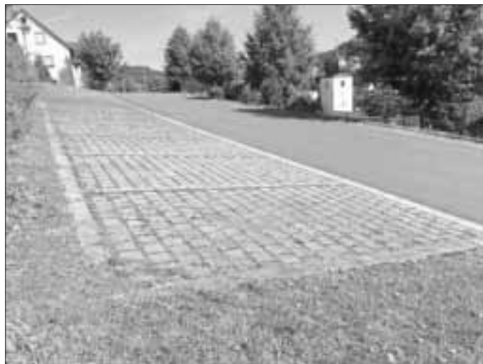
Parkplätze oberhalb des Friedhofes.

Rechts vom Eingang Leichenhaus befindet sich die Parkfläche. Nicht zugestanden werden darf die Pflasterfläche und die Zufahrtsfläche (links vom Pflasterbelag) zum Friedhof.