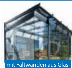
mit Faltwänden aus Glas