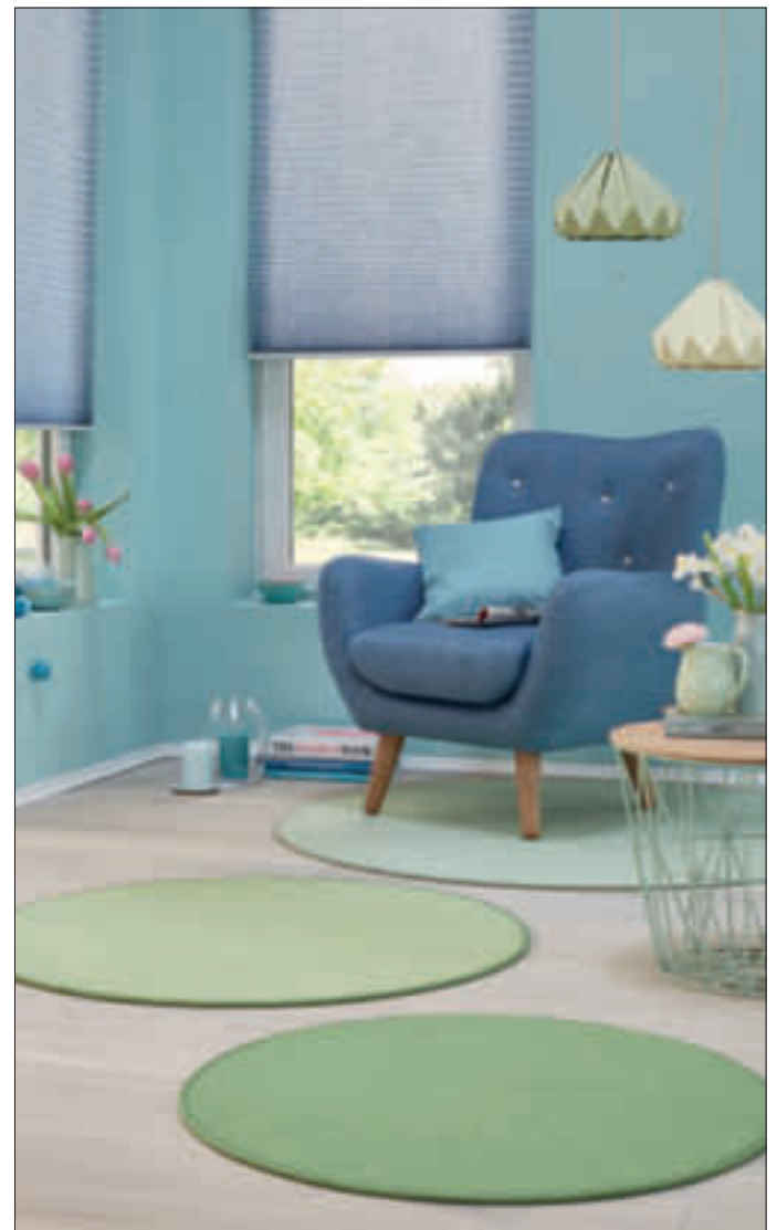
Behaglich, strapazierfähig und leicht zu pflegen: tretford-Teppiche werden mit Liebe zum Detail, in präziser Handarbeit, in Deutschland hergestellt.

Noch individueller wird die Raumgestaltung mit den mehrfarbigen Interart-Designs. Das feine Zusammenspiel von Farbe, Form und Struktur spiegelt sich in diesen Teppichen wider. Mit der persönlichen Farbkombination entsteht ein ganz persönliches Lieblingsstück für den Wohlfühlplatz – elegant, dezent oder farbenfroh. tretford-Teppiche sind behaglich, strapazierfähig und leicht zu pflegen. Sie werden mit Liebe zum Detail, in präziser Handarbeit, in Deutschland hergestellt. Mehr Informationen unter www.tretford.eu