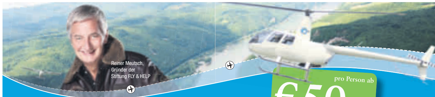
Reiner Meutsch, Gründer der Stiftung FLY & HELP