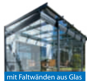
mit Faltwänden aus Glas