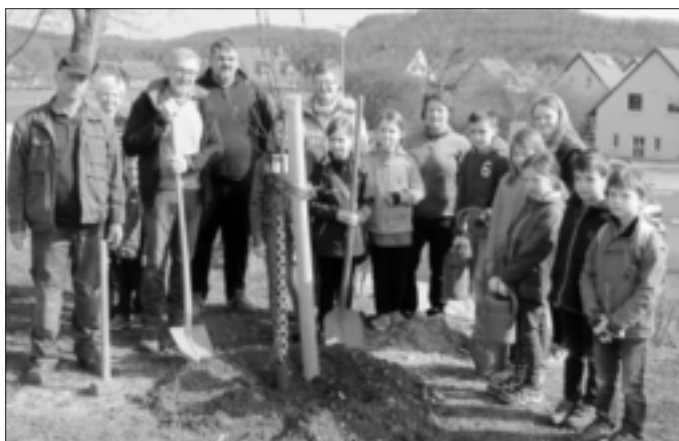
Baumpflanzung an der Grundschule

Sehr erfreulich war die große Zahl der Teilnehmer beim diesjährigen Tag der Umwelt in der gesamten Marktgemeinde Heiligenstadt.