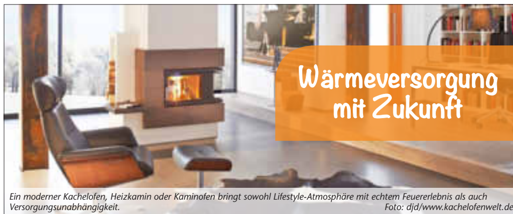
Ein moderner Kachelofen, Heizkamin oder Kaminofen bringt sowohl Lifestyle-Atmosphäre mit echtem Feuererlebnis als auch Versorgungsunabhängigkeit.

Ein moderner Kachelofen, Heizkamin oder Kaminofen bringt sowohl Lifestyle-Atmosphäre mit echtem Feuererlebnis als auch Versorgungsunabhängigkeit und Entlastung für die Zukunft: ökonomisch und ökologisch. Holz verbrennt CO 2 -neutral - das heißt, es wird nur