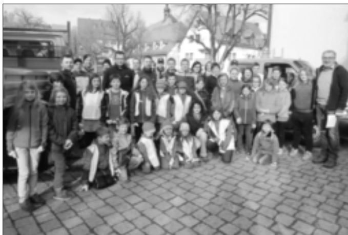
Start am Marktplatz

Viele Kinder beteiligten sich an den Aktionen