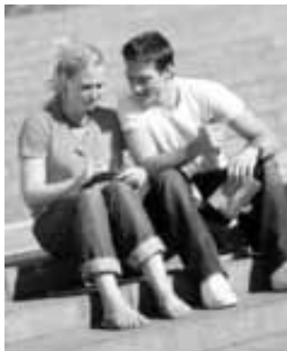
Noch jeder Zweite schickt Urlaubsgrüße auf Ansichtskarten.

(rgz-p/su). Kurzmitteilungen sind keine Erfindung des digitalen Zeitalters. Vor SMS und Messenger Apps kam weit über 100 Jahre lang die Postkarte dafür zum Einsatz.